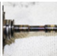
Lagerstellen der Welle be- schädigt durch Öl- mangel