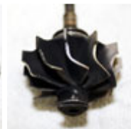
Turbinenrad an Turbine- gehäuse angelaufen