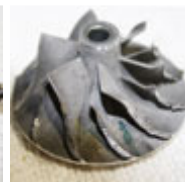
Verdichterrad an Verdichter- gehäuse angelaufen